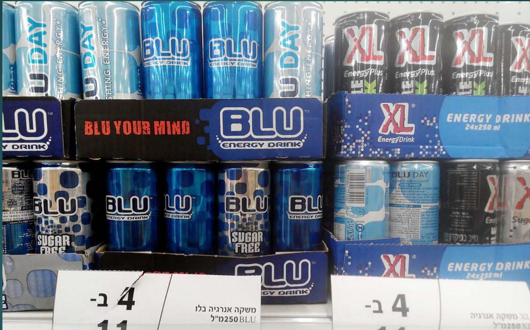
Exposición en un supermercado de distintas marcas de bebidas energéticas